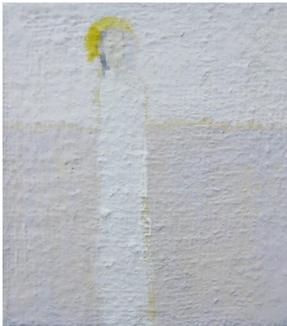
Slika 9: Uskrsnuli Krist , 2016.

onakraj granica stvarnosti. Ta svjetlost se prepoznaje kao vlastita misao, ideja, i uvijek se javlja kao jasna potreba za njenom realizacijom.