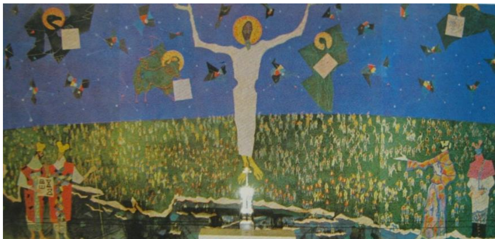
Slika 7: Ivo Dulčić, Krist Kralj , 1959. [12]

U mračnoj splitskoj crkvi Krist, kao i cijela freska, djeluje svjetlom. Kao i prozori franjevačke crkve na Kaptolu u Zagrebu, kupaju se u unutrašnjem i izvanjskom svjetlu. U njima Dulčić intimistički konstruira i usklađuje unutrašnju svjetlost koja izvire iz forme s božanskim dinamizmom svjetlosti dana što prodire kroz stakla. Ova dvostruka priroda svjetlosti vrlo je česta u njegovim djelima. Dulčićeva svjetlost dolazi iznutra i nastoji se spojiti sa svjetlošću izvana. Nastoji stići iz nečiste materije i putem se vedriti suncem. [10]