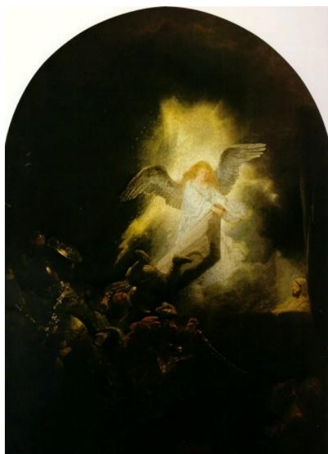
Slika 6: Rembrandt, Uskrsnuće Kristovo , 1635.-1639. [15]

Česta tema Rembrandtova slikarstva nije vanjsko zbivanje, nego duševni odnos između ljudi. U prošlom stoljeću nazivali su ga „majstorom unutarnjeg događanja. Ovo za modernog čovjeka zvuči pomalo sentimentalno, ali predstavlja važnu crtu Rembrandtove umjetnosti. Unutarnje zbivanje je bitnije nego povijest. Geste i držanje figura, kao izraz unutarnjeg doživljavanja, izazivaju kod gledatelja najdublju ganutost.