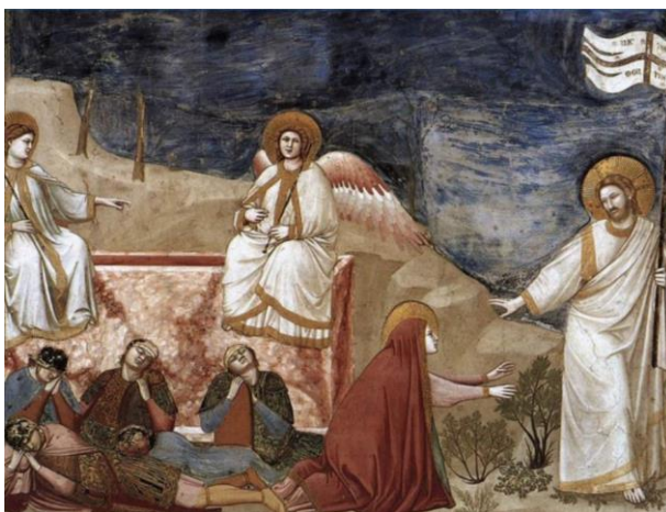
Slika 2: Giotto, Uskrsnuće , 1304.-1306. [16]

Ciklus fresaka Scrovegni ide preko trenutaka koji neposredno prethode Kristovom stradanju i Uskrsnuću. Cijela scena Uskrsnuća sjedinjava, u jednoj jedinoj slici, temu praznog groba nad kojim lebde anđeli i temu javljanja uskrsnuloga Krista Mariji Magdaleni. Na žalost, gornji dio freske je uništen. Pod naknadnim, premazom nestale su krošnje drveća s lijeve strane, ali je sačuvana uzdržana, zamišljena, apstraktna atmosfera koja kao da, u skraćenim i nepomičnim figurama vojnika što spavaju, anticipira mirnu viziju Piera della Francesca. Giottova freska Uskrsnuće nastala je u razdoblju od 1304. do 1306. godine. Prikaz teme Uskrsnuća je postavljen u formatu gotovo kvadratnog oblika. Jasnim odnosom svjetla i tame formirana je vodoravna podjela preko zida. Cijelina prizora je smještena u visini točke gledišta gledatelja, što omogućava da pogled promatrača dopre u samu intimnost trenutka. Boja neba je sačinjena emotivnim potezima kista uronjenog u sivu, crnu i plavu boju. I ovdje su prikazani detalji prirode, grmlje i stablo malih dimenzija.