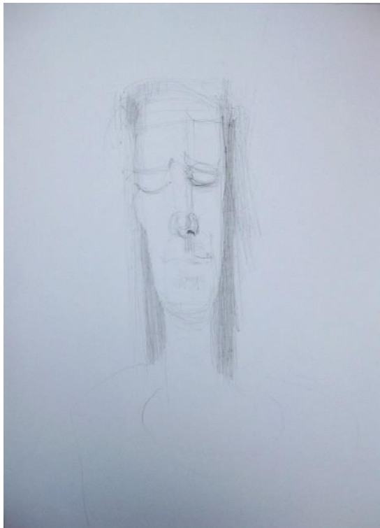
Slika 10: Ecce homo , 2015.

svim njenim mijenama, onim trenutnim kao i onim vječnim, tajnovitim, koje se mogu tek naslutiti. Unutar prostora likovi su smješteni u samoj intimističkoj tišini svog postojanja, u tišini u kojoj je prisutna sva punina života.