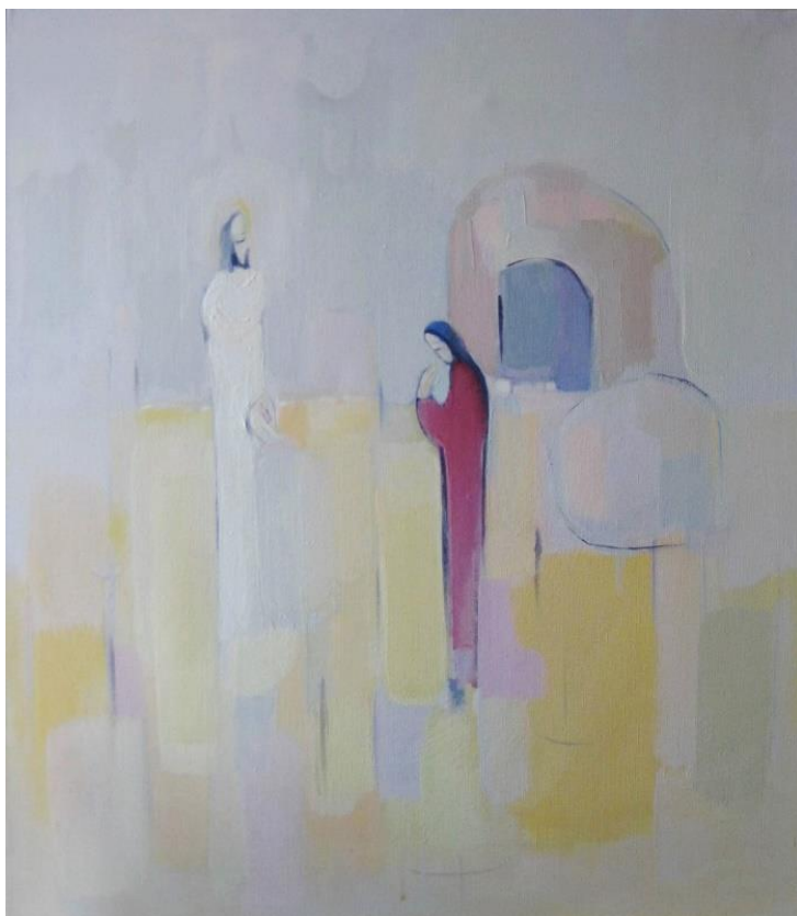
Slika 11: Susret (Na uskršno jutro) , 2013.

Jedna od osnovnih značajki ovog stvaranja jeste njegova intimistička tektoničnost. I slika i crtež su smješteni u svoj unutarnji vlastiti prostor u ritmu nekih okomitih i vodoravnih odrednica stvarajući kompozicije s pokrenutom dinamikom ili pak samom asimetrijom. Postavljaju se planovi, blokovi ploha, izražavajući time jednostavnost intimizma likovnog izričaja. Ta povučena crta predstavlja najintimniji trag, zapis o vlastitom postojanju.