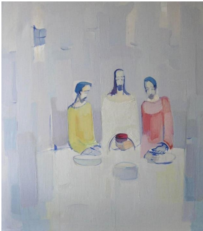
Slika 12: Večer u Emausu , 2014.

iznuđuje svjesnu borbu čovjeka za svoju bit. Potrebno je da čovjek uz sebi postavljene pretpostavke ponovno iz ishodišta proizvede svoj svijet. Potrebno je prijeći svoju granicu tako da se nasluti svoja transcendencija. [5]