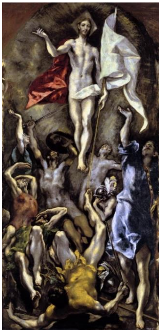
Slika 5: El Greco, Uskrsnuće , 1584.-1594. [14]

božanskim svjetlom, dok jedan od vojnika pada izvan okvira slike, prema promatraču. Slika je ispunjena slojevitošću, predstavlja kombinaciju bizantijske mistike s bogatstvom turobnih boja venecijanskog manirizma. Uspio je izraziti suštinu španjolske umjetnosti: suptilnu senzualnost, sofisticiranost i jedinstven emocionalni naboj.