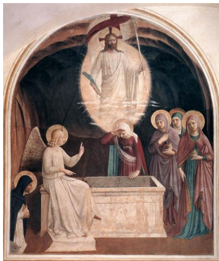
Slika 3: Beato Angelico, Uskrsnuće , 1440.-1442. [17]

tražeći od njega neko nijemo objašnjenje. Iako fizički prisutan i jasno vidljiv, cijeli lik anđela odaje nestvarnu pojavu, koja u sebi krije neku vrstu ohrabrujuće sigurnosti i utočišta. U lijevom donjem kutu, do anđelovih nogu, sv. Dominik pognute glave i spuštenu pogleda kleči i moli. Iz tamne pozadine nad svima bdije svijetla pojava uskrsnulo Krista.