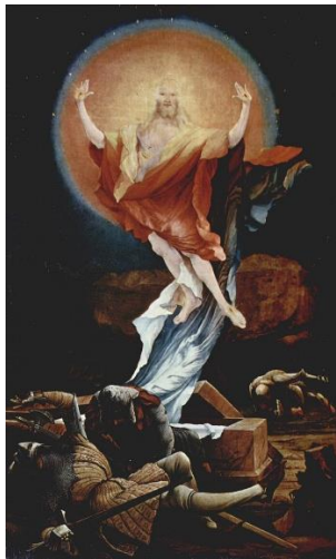
Slika 4: Matthias Grünewald, Uskrsnuće Isusa Krista , 1512.-1516. [13]

Na Uskrsnuću oltara iz Isenheima, okupan svjetlošću, gotovo razornom snagom uzlijeće iz groba i u duginim bojama treperi i vlastitim životom živi uskrsli Krist. [1]