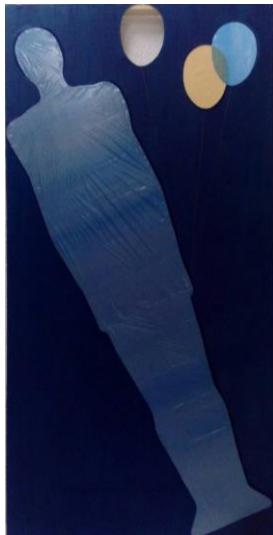
Slika 9: Lijepljenje na iluzije

prolazno i nebitno. Navike i ideali usredotočuju čovjeka na ono što bi trebao biti, a ne na ono što jest. I tako se nameće ono što bi trebalo biti onome što je sada stvarnost.