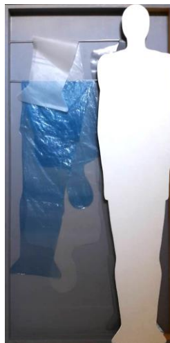
Slika 8: Svlačenje sebe

Umiranje je divno; užasno je samo za one koji nikada nisu shvatili život. Kao što je spomenuto u drugom poglavlju, tragički osjećaj života je njegovo potvrđivanje, ushićeno pristajanje na strahovito i propast. Život i smrt su neodvojivi te postoje kao osnovno proturječno jedinstvo pra-temelja. Nedostatak budnosti i svjesnosti jedina je tragedija ovoga svijeta. Upravo to rezultira strahom, ali smrt nije nikakva tragedija. Strah od smrti postoji samo ako se čovjek boji života. Što znači buđenje? Buđenje je smrt vjerovanja u postojanje nepravde i tragedije. Umiranje stvarima radi potpunog življenja svakog trenutka – to znači buđenje. Živjeti kao mjesečar u stanju sna uvijek će ispoljavati sitne ljudske bolesti ratova, nasilja i nejednakosti. Ovaj rad simbolizira „smrt pripadajućega“. Onostrani prikaz slike omogućio je prelamanje siluete čovjeka na dva dijela. Cjelina ne znači nužnu ispravnost ako je potrebno odreći se i odbaciti polovinu krivoga. Pripadajuće je trenutno,