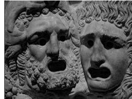
Slika 3: Amfiteatar (lijevo), reljefni prikaz „lica“ tragedije (desno) [15]

Antička drama uvjetovana je scenskim prostorom i vremenom koji oblikuju jedinstvenu i preglednu radnju. Kao dramska vrsta, grčka tragedija nastala je iz dionizijskih ditiramba - tragičkih korova pjevanih u slavu boga Dionizu. Velika religijska ideja iskupljenja svijeta kroz patnju i bol odražava se i živi u tragediji. U suštini ona je bila samo tragički kor, a kasnijim pridavanjem dijaloga uspostavlja se scenska radnja. Time je završen proces „objektivizacije“ grčke tragedije kao umjetničkog djela. [2]