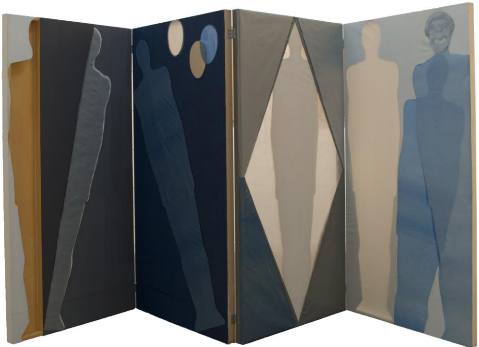
Slika 4: Filozofska i teatralna refleksija čovjeka

teatralni dojam. Za realizaciju likovnog djela inspiracija se tražila najviše u osobnim razmišljanjima i stavovima, ali i okruženju u kojemu se živi. Dvogodišnji rad i promišljanje o čovjeku kao kompleksnom i slojevitom misaonom biću, stvorilo je vlastitu predstavu u prostoru. Ona u isto vrijeme otkriva i sakriva, prikazuje osobna stanja i razmišljanja, a ostavlja potencijalna pitanja i „prostor“ za razmišljanje. Čitav proces analize čovjeka kroz teatralnu manifestaciju pronašao je svoje uporište u određenom razdoblju, autorima i njihovim dijelima. Finalizacija ideje obuhvaća višegodišnje stečeno znanje i iskustvo. Život je moguće prikazati kao umjetničku igru. Svijet, biće u cjelini jest igra. Pojava individuacije, mnogostrukosti pojedinačnosti bića u različitosti onoga stravičnog i lijepog jest lijepi privid u smislu tragičke vizije, odnosno „umjetnička igra, koju volja, u vječnoj punini svoje naslade, igra sama sa sobom“. [6] [11]