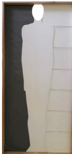
Slika 10: Nenavezanost

Samopažanje često odvede čovjeka u krivome smjeru. Tko sam ja? Vječno neodgonetnuto pitanje koje u većini slučajeva rezultira neispravnim odgovorom. Definiranje „sebe“ i „ja“ dvije su potpuno različite stvari. Sve što je pripadajuće ne može biti „ja“. Vlastite misli, tijelo, ime, zanimanje ili uvjerenja – sve su to netrajne i promjenjive etikete. A poistovjećivanjem s takvim etiketama gubi se vrijednost suštinskog „ja“. Kada se čovjek poistovjeti s nečim u njemu ili izvan njega, nastaje patnja. Ovaj rad prikaz je „svlačenja sebe“. Tko živi u meni? Ljudsko mišljenje o slobodi zarobljeno je u tuđe geste, stavove, misli i vjerovanja. Prikaz čovjeka koji se istisnuo iz okvira mehaničkog života odlikuje ovu sliku. Svi slojevi skinuti sa suštinskog „ja“ ostavljeni su u izlogu okvira kao podsjetnik na prošla iskustva, uvjetovanost i programiranost. Gola figura čovjeka postavljena je izvan drvenog okvira kao simbol istinske srži čovjekova jastva.