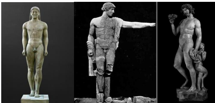
Slika 1: Primjeri grčkih skulptura [17]

koji funkcionira bez međusobne podređenosti. Grčki kipari je uspješno i snalažljivo ostvaruju tako da se skulpturom ne nameću arhitekturi niti su skulpturu podredili arhitekturi. Primjer grčkog zabata pokazuje tu suradnju arhitekta i kipara. Plitki trokutni zabat „uokviruje“ praktično postavljene likove, od najvišeg uspravnog u središtu do ležećeg na krajevima. Prema tome se da zaključiti kako je poza likova imala vrlo važnu ulogu u postizanju sklada, a oblik trokuta uvjetovao je da figure s lijeve i desne strane budu oblikovane u brojnim nezgodnim pozama.