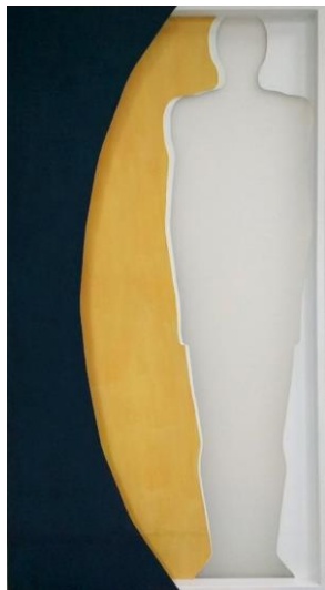
Slika 6: Mjesečarenje

Ljudsko opažanje stvarnosti odvija se kroz „filtre“. Sva osjetila prenose informacije iz stvarnosti, ali čovjek nesvjesno filtrira stvarnost na određen način. Ovaj rad prikazuje „filtriranje stvarnosti“. Središnji lik zaglavljen je u romboidni oblik kojeg tvore četiri trokutne najlonske plohe. Prekriven je komadom tankog materijala koji ostavlja dojam filtra. Oblik romba na radu nastao je spajanjem dvije izlomljene zagrade i kose crte koja ih dijeli kao informatički simbol programiranja.