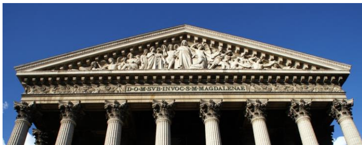
Slika 2: Zabatni trokut [16]

Utjecaj i doprinos grčkoj kulturnoj povijesti dali su mnogi filozofi, pisci, i pjesnici. O slikarima su grčki filozofi imali podvojena mišljenja i veoma različite prosudbe. Aristotel je cijenio njihovo umijeće i nastojanje da se umjetničko djelo što više približi prirodi i zbilji ( mimesis ). Platon je pak smatrao da je sve