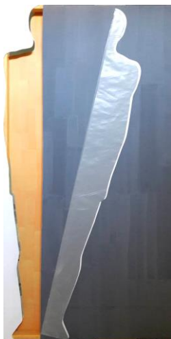
Slika 7: Smrt pripadajućeg

uma i tijela. Metalne šipke jednom stranom horizontalno povezuju figuru, dok drugom stranom probijaju okvir i strše u prostoru. Takvom postavkom i primjenom ukazano je na nenavezanost, slobodu uma i probijanje izvan okvira uvjetovanosti.