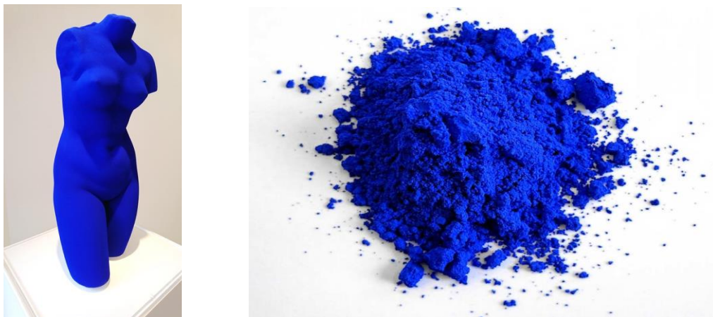
Slika 4: Lijevo: Yves Klein, Venus Blue , 1961., gipsana skulptura obojena IKB bojom; desno: umjetni ultramarin

stoljeća. Uzmimo primjer pojave kromovih boja koja će označiti slikarski identitet Van Gogha; kromova žuta između ostalih na njegovim suncokretima, kromhidroksid viridijan zelena na čempresima – što ga sasvim izdvaja iz spektra, uzmimo njegovog zemljaka prije dva stoljeća, Rembrandta.