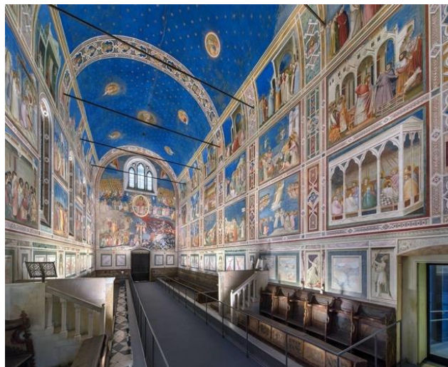
Slika 3: Lijevo: kamen lapis lazuli; desno: freske Giotta u kapeli Scrovegni u Padovi, 1303.-1305. godina