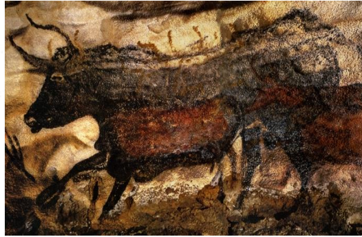
Slika 1: Lijevo: manganov dioksid, hausmanit; desno: hausmanit na uzorku Velikog bika iz pećine Lascaux, prije 17.300 god.

Tome nas navode i dokazi čovjekovog ponašanja u Australiji, gdje slikarska tradicija seže unazad i do 40 000 godina i gdje od samih početaka obilato nalazimo crveni oker u upotrebi. Značaj crvenog okera je znamenit u primitivnoj Australiji. Tiwi otoci, s populacijom od nekolicine tisuća stanovnika, vjerovali su da su jedini ljudi na svijetu. Tiwi na lokalnom jeziku znači „mi, jedini narod“. Crvenim okerom su se u samo određenim ritualima muškarci bojali po tijelu, žene nikada, crveni pigment je smatran opasnim (moguće zbog boje krvi, ali i jer ovaj pigment svjetluca, a sve do 17-og i 18-og stoljeća i dolaska Evropljana u Australiju, domoroci nisu imali pristup staklu, niti metalu, pa su stoga možda vjerovali kako svjetlucavost crvenog okera ima nepoznate i opasne efekte.) Iako se crveni oker svuda nalazi u Australiji (iz zraka se čitav kontinent doima crveno), neka od bogatih nalazišta bila su Wilga Mia, Campbell Range na zapadu Australije, kao i Bookartoo, Parachilna na jugu, do kojih se izgleda oduvijek putovalo tisućama kilometara. Kasnija praksa će dokazati, pisma koja svjedoče da je do 1880. oko 80 mladića iz plemena Diyari u okolici jezera Howitt svake godine putovalo do Parachilne na jugu kako bi nabavili crveni oker. Zapisi svjedoče kako su ova putovanja od oko 1.500 kilometara trajala oko dva mjeseca.