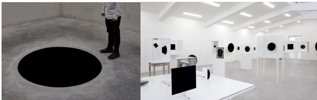
Slika 5: Lijevo: Anish Kapoor, Descent Into Limbo , 2018., desno: Kapoor studio 2020., prvi Vantablack radovi prikazani javnosti, za izložbu u Gallerie dell'Accademia di Venezia u sklopu Venecijanskog bijenala 2022.

Britanski umjetnik indijskog porijekla Anish Kapoor otkupio je sva prava na korištenje ove boje, što je izazvalo velike polemike pa čak i društvene pokrete, kampanje i blago rečeno afere pod popularnim nazivom na socijalnim mrežama Free Vantablack! (engl. Oslobodi Vantablack!)