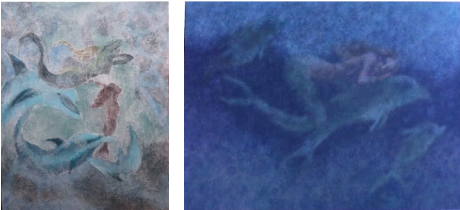
Slika 5: Nerej promatra kćeri u igri (lijevo), Amfitrita u igri (desno)

tišini vlastitog bića, a za njom se čezne, ona je za nju esencijalna. Fragment stvara prived svojevrsne paralize stvarnosti, osjećaja, koji je u vezi s neponovljivosti doživljaja. Tajnovite nereide, boginje unutarnjeg mora, razigrane, baš kao i površina mora kojoj se predaju pod budnim okom boga Nereja. Homer ih spominje poimence četrdeset i četiri. Omiljeni su motiv u umjetnosti stare Grčke i Rima, naročito u figuralnim umjetnostima i slikarstvu. Marin Držić ih spominje u posljednjem, trećem prizoru drugoga čina Hekube .