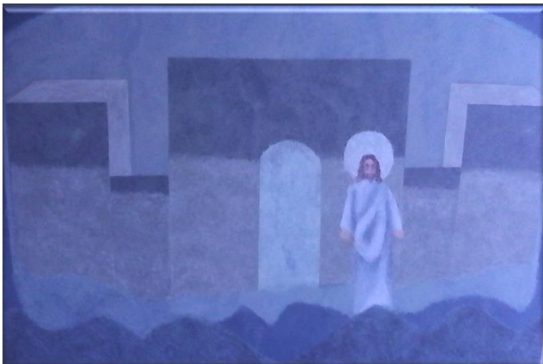
Slika 3: Nebeski Jeruzalem

Obradom biblijskih tema nastoji se doprijeti do dubinskog smisla kako bi se poruka mogla prenijeti na platno. Nastoji se oživjeti osjećaj uzvišenoga, sublimnoga, uz osobno obojen prikaz, a ipak u okviru tradicionalne kršćanske ikonografije. Osjećaji su koncentrirani na očitovanje vlastitog slikarskog govora, uz potpunu svijesnost Istine; ekstaze ljubavi iz koje je i Crkva proistekla. Sakralna slika ima svoje značenje i poruku. Nadahnuta je, prepričana i doživljena. Ima svoju moć koja izvire iz nadahnuća samog autora. Ako je u pitanju sakralna umjetnost, njena moć je povezana s Biblijom, iz povezanosti koju slikar ima sa svojim Stvoriteljem i njegovim nadahnućima. Nastala slika progovara sa svojim atributima i alatima.