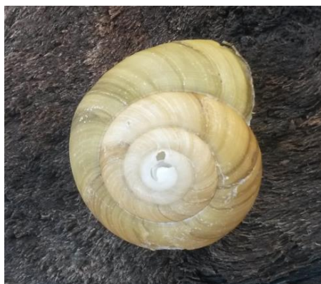
Slika 1: Primjer zlatnog reza na spirali puževe kućice

drugim, ali i cjelina s dijelovima. Tako se komplementarnosti povezuju u skladnu cjelinu. Brojčano se može izraziti kao konstanta čija veličina iznosi 1,6180339... Matematičari koriste grčko slovo \phi da bi ga označili. Euklid Aleksandrijski prvi je izrazio zlatni rez u svojoj knjizi „Elementi“ oko 330. g. pr. Krista. Konstruiramo li pravokutnik čije su stranice dva dijela dužine odijeljene zlatnim rezom, dobit ćemo zlatni pravokutnik, gdje je jedna stranica 1, a druga je \phi . Ako od zlatnog pravokutnika odrežemo kvadrat, ostati će zlatni pravokutnik, a ako unutar niza kvadrata koje dobijemo uzastopnim odsijecanjem od pravokutnika konstruiramo lukove, dobit ćemo zlatnu spiralu.