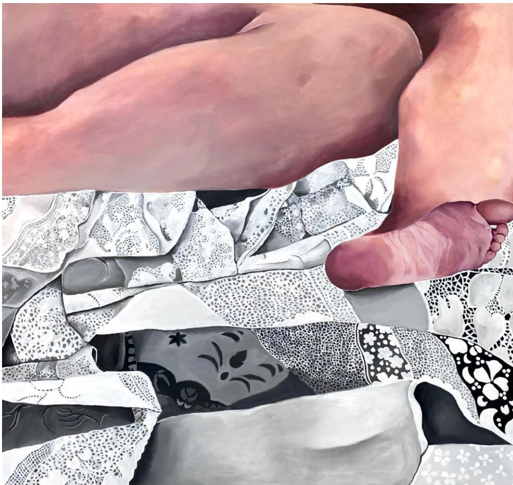
Slika 9: Topografija tjelesnosti 3 , 2025.

simbol tjelesnosti i nesavršenosti. Poseban kontrapunkt predstavlja pozadina – izuzetno detaljna i ornamentalna etno čipka. Taj motiv čipke simbolizira delikatnost, tradiciju i ženstvenost, a u ovom kontekstu djeluje kao kontrast teškim, masivnim oblicima ženskog tijela.