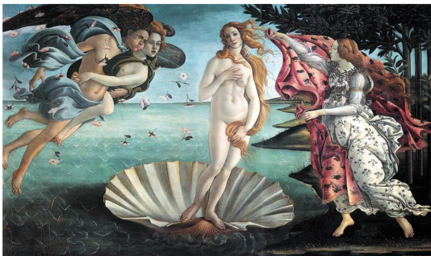
Slika 2: Sandro Botticelli, Rođenje Venere , 1482. - 1486. [6]

Pojavom renesanse aktovi gube svoj ikonografski karakter i postaju cijenjeni i prihvaćeni zbog svojih estetskih i senzualnih kvaliteta. Sandro Botticelli je prvi umjetnik koji je naslikao ženski akt bez potrebe da ga opravda nekim vjerskim razlogom. Radi se o ženskoj figuri gotovo u prirodnoj veličini koja graciozno otkriva svoje tijelo. Djelo Rođenje Venere (slika 2) ipak ima određenu dozu bijega od cenzure zbog pozicije Venerine kose i ruke koji djelomično prikrivaju genitalije i ženstvenu oblinu glavnog motiva. Unesena je erotska dimenzija zbog polemike onoga što Venera skriva i onoga što izlaže. Njezin položaj produkt je antičkog kontraposta koji naglašava bokove i vitkost figure. Botticellijeva Venera odmiče se od tradicije srednjeg vijeka i religioznih tvrdnji te se kreira put za nove prikaze ženske figuracije.