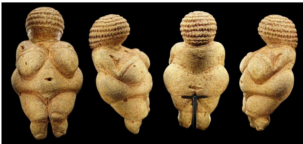
Slika 1: Willendorfska Venera , oko 25 000. - 21 000. pr. Kr. [3]

Predstavljanje ljudskog tijela kroz povijest umjetnosti datira još od prapovijesti. Žanr akta moguće je asimilirati s enormnim brojem slikovnih subjekata koji će se spomenuti u daljnjoj analizi. Na samom početku od velike je važnosti spomenuti jednu od najstarijih skulptura u povijesti. Riječ je o Willendorfskoj Veneri (slika 1) staroj oko 25 000 godina.