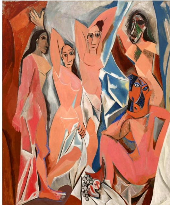
Slika 6: Pablo Picasso, Gospođice iz Avignona , 1907. [13]