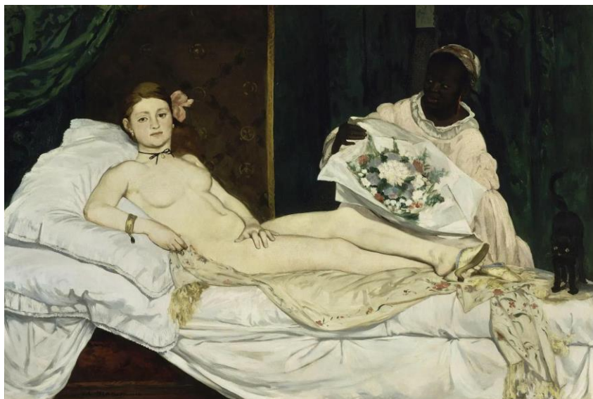
Slika 3: Edouard Manet, Olimpija , 1863. - 1865. [4]

koji je radikalno odbacio tadašnje akademske norme je Edouard Manet. Moderni slikar poput Maneta želio je prikazati stvarnost svoga vremena naslikavši Olimpiju (slika 3). Skandaloznost ovakvog djela proizlazi iz saznanja da je Olimpija prostitutka, a ne mitološka božica. Manet je jednostavno naslikao vlastitu stvarnost bez potrebe za idealizmom, međutim sredinom 19. stoljeća prikazivanje akta bilo je dozvoljeno samo ako se nalazio u mitološkom ili egzotičnom prostoru. Olimpija je u ovom slučaju snažno individualizirana i provokativna gledajući izravno i ravnodušno u promatrača. Upravo taj pogled uz prisustvo ravnodušnosti izaziva skandal. Na akademskim slikama nage ženske figure mimikom odaju dojam iznenađenosti, kao da nije svojevrijemno prikazana u takvom izdanju. Međutim, Olimpija kontrira tadašnjoj ideji žene.