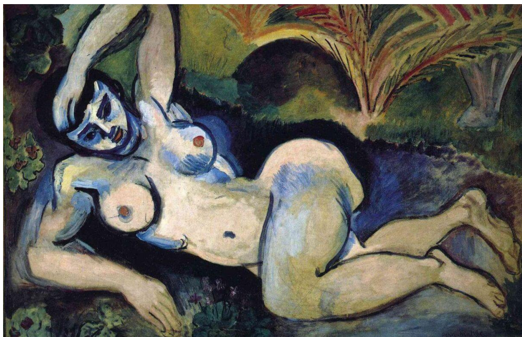
Slika 5: Henri Matisse, Plavi akt , 1907. [10]

načinu prezentiranja ljudske figure. Akademizam je težio realnom prikazu akta s glatkim i mekim linijama, no Matisse odstupa od standardiziranih normi kreirajući grublji i drugačiji portret. Anatomski pristup motivu odaje dojam mišićave ženske figure kojoj je dodatno eliminiran osjećaj mekoće. [11]