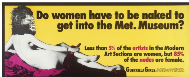
Slika 7: Guerrilla Girls, Moraju li žene biti gole da bi ušle u Met Muzej? , 1989. [7]

Guerrilla Girls deklariraju se kao feminističke aktivističke umjetnice koje nose maske skrivajući vlastiti identitet. Aktivne su i danas, a njihovi počeci datiraju iz 1985. godine. Skupina je nastala reakcijom na MoMA-inu izložbu Međunarodno istraživanje novijeg slikarstva i kiparstva 1984. godine. Izložba je trebala predstavljati vrhunske umjetnike svijeta, no od 169 prikazanih umjetnika samo je 13 žena. Riječi kustosa Kynastona McShinea dodatno su uzburkale javnost poručivši da bi svaki umjetnik koji nije bio na izložbi trebao ponovno razmisliti o svojoj karijeri. Zbog ovakvog tretmana, skupina umjetnika prosvjedovala je vani na samu večer otvorenja. Budući da promatrači nisu bili zainteresirani za njihovu poruku godinu dana kasnije osniva se Guerrilla Girls s ciljem pronalaska novih načina pobune kroz uličnu umjetnost. Iako su započele kao aktivistička grupa postupno ih je prihvatio i svijet umjetnosti te su izlagale svoje radove u galerijama kao što su MoMa i Tate Modern. Djelo Moraju li žene biti gole da bi ušle u Met Muzej? (slika 7) nastalo je 1989. nakon što su članovi grupe prošetali Metom i uočili omjer umjetnica i ženskih aktova.